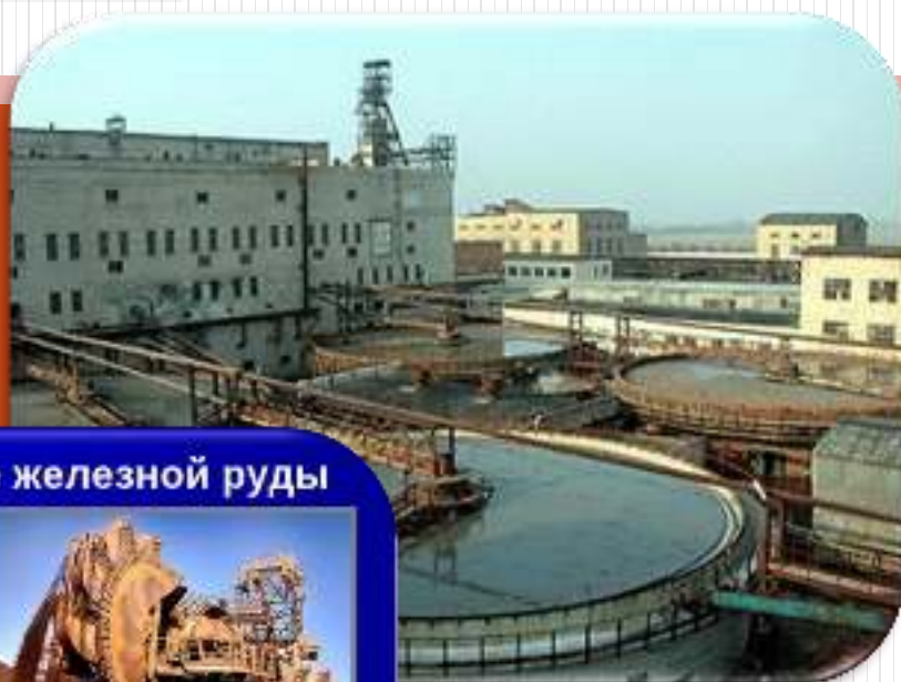
Добыча и обогащение железной руды